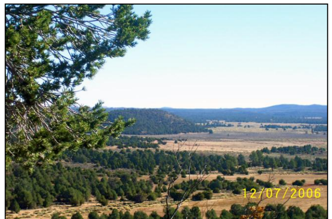
Vista parcial de la “Hacienda La Esperanza”

Acabamos de adquirir (7 de Diciembre del 2006) una hacienda de 1325 acres (530 hectáreas) en Baja California, México, cerca de Tecate, a 15 millas al sur de la frontera con los Estados Unidos. En un fértil valle rodeado de montañas cubiertas de bosques de pino, esta propiedad servirá como sede mundial del ministerio. El proyecto incluye el edificar los edificios necesarios para el ministerio y sus varias ramas de servicio tales como: el Instituto de Preparación Laica, el Centro de Evangelismo, una Escuela Secundaria Bilingüe con internado, una escuela de agricultura, la estación para el canal satelital, un orfanato, una Clínica de Vida Sana, un hogar de ancianos y también industrias que provean trabajo para jóvenes estudiantes y familias adventistas. Y todo esto se hará siguiendo el modelo que nos ha dado Dios a través de la Biblia (escuela de los profetas) y el Espíritu de Profecía.