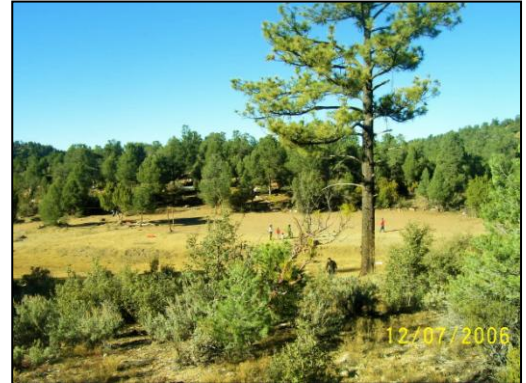
En medio de hermosos bosques de pino

Necesitamos sacar a nuestros jóvenes de las ciudades antes que los perdamos para la eternidad, a recibir una educación centralizada en Dios y en el servicio misionero. Les enseñaremos servicio médico misionero, cómo visitar los hogares y dar estudios bíblicos, destreza en la agricultura y el colportaje al mismo tiempo que reciben su educación secundaria. Combinarán el estudio con la labor manual y los fines de semana visitarán las ciudades cercanas para colportar, dar estudios bíblicos y apoyar las iglesias de los alrededores. Necesitamos edificio de aulas, dormitorios de niñas y varones, un centro estudiantil (cafetería, biblioteca/study hall y centro de computación).