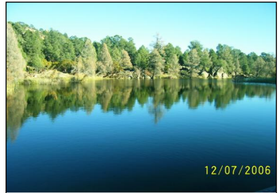
La Hacienda tiene un pequeño lago