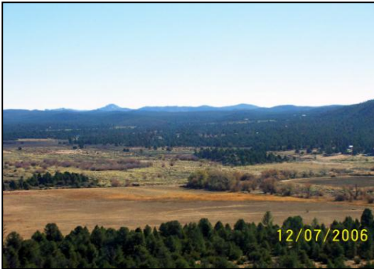
Mucha tierra de cultivo en medio de bosques

trabajados con el mensaje del evangelio eterno por nuestros alumnos y personal. Estamos tan solo a 1 hora de Tijuana (población: más de 2 millones); 1 hora y ½ de San Diego (población: 3 millones) y 1 hora de Mexicali-Calexico (población: 1 millón). Censo del 2000, mucho más grandes hoy día. Y a una distancia de no más de 2 ½ horas de los condados de Los Angeles, Riverside, Orange, San Diego e Imperial con población de más de 24 millones (Enciclopedia Wikipedia) La región del Sur de California es la segunda área de mayor concentración de población en los Estados Unidos, y casi la mitad de esa población es hispana.