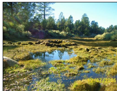
Beautiful meadows with plenty of water

g. Lechería y Apicultura: La lechería como industria, y la producción de la miel para consumo y venta.