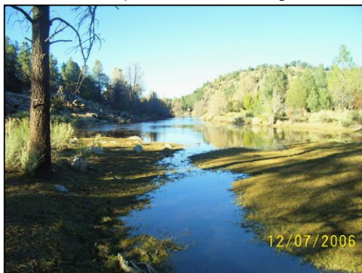
Un río atraviesa la Hacienda

11. Industrias y Servicios: Para proveer una base financiera para las distintas ramas del ministerio, de forma tal que lleguemos a ser verdaderamente de sostén propio y no dependientes de donaciones, estableceremos una variedad de industrias. También estas proveerán fuente de empleo para los estudiantes, para que ninguno sea rechazado por falta de fondos, sino que puedan financiar su educación cristiana parcial o totalmente. Además de los trabajos tradicionales como huerta, cocina, dormitorios, limpieza y mantenimiento, etc., los estudiantes tendrán las siguientes oportunidades de empleo: